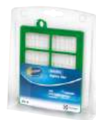
Filtre d'évacuation d'air EFH12 s-filter®