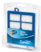
Filtre d'évacuation d'air EFH12W s-filter®