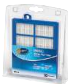
Filtre d'évacuation d'air EFS1W s-filter®