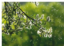
Breathe360 Pollen Protect