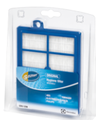
Filtre d'évacuation d'air EFH12W s-filter®