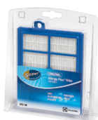
Filtre d'évacuation d'air EFS1W s-filter®