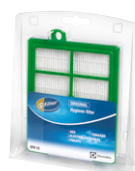
Filtre d'évacuation d'air EFH12 s-filter®