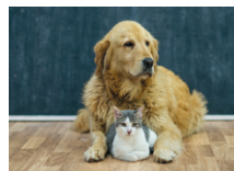
Fresh360 Odour Protect