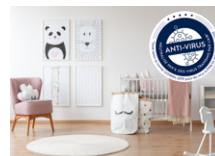
Care360 Ultimate Protect